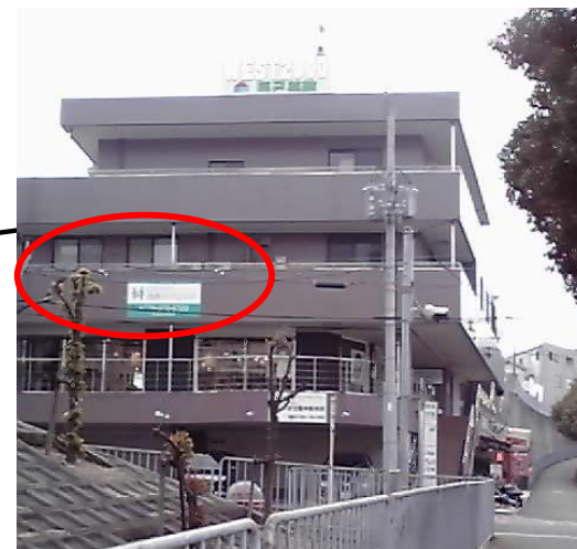
坂の下から曲がり角を見た写真